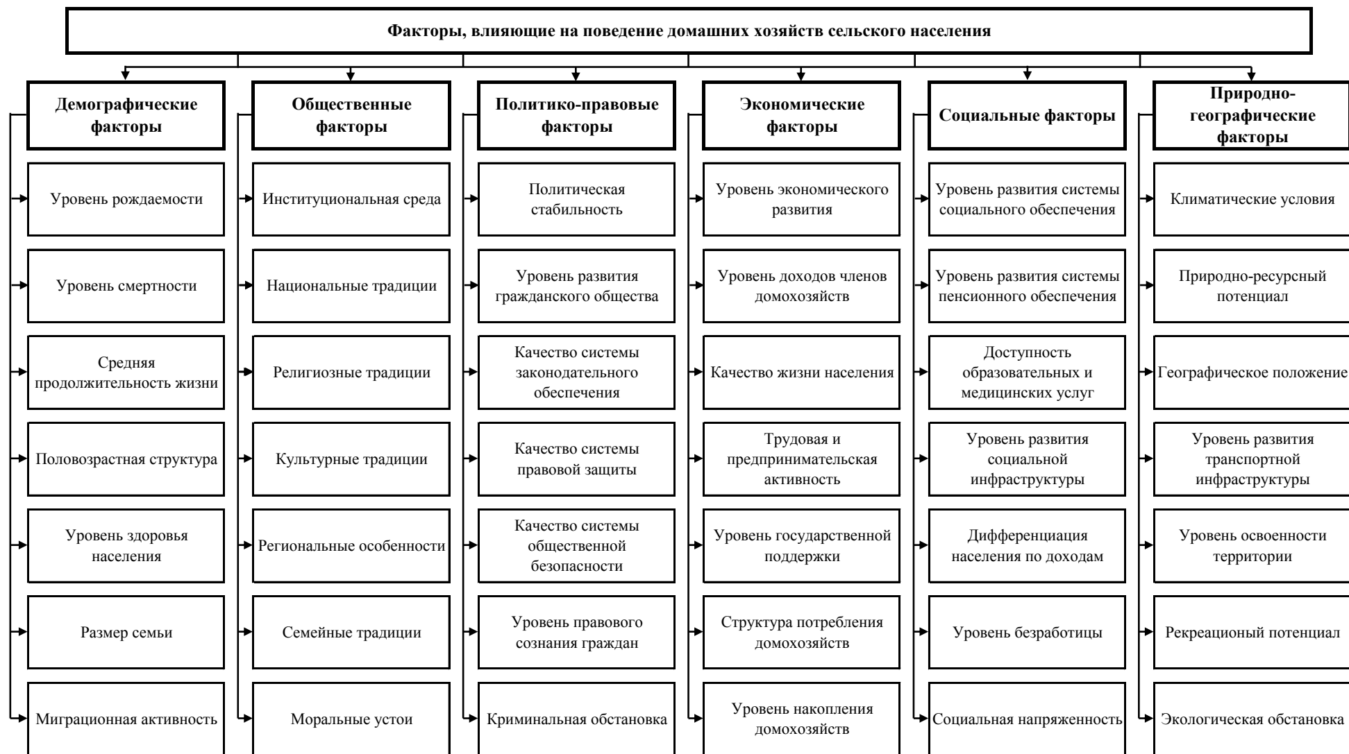
Рисунок 2 – Факторы, влияющие на поведение домашних хозяйств сельского населения