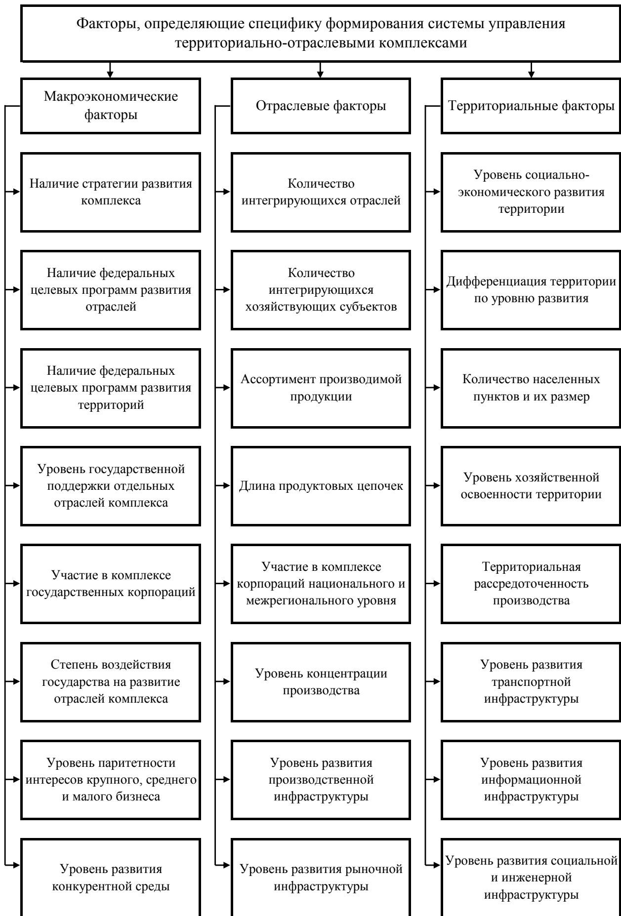
Рисунок 1 - Факторы, определяющие специфику формирования системы управления территориально-отраслевыми комплексами