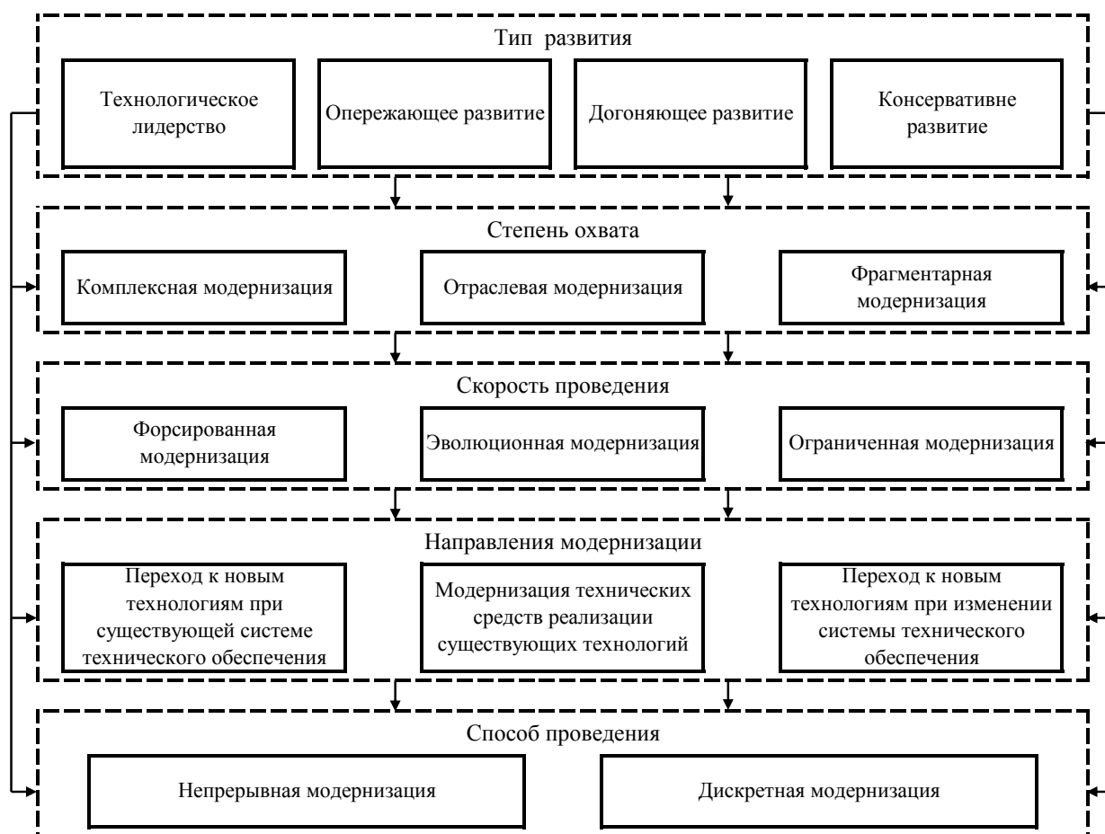
Рисунок 3 – Совокупность характеристик, влияющих на содержание конкретных моделей технико-технологической модернизации

По данному критерию предлагается различать форсированную модернизацию (при возможности реализации масштабных инновационно-инвестиционных проектов в относительно короткие сроки), эволюционную модернизацию (обновление технических средств происходит по мере их физического и морального износа в рамках обеспечения расширенного воспроизводства агроэкономических систем) и ограниченную модернизацию (допускает использование технических средств сверх нормативного срока использования и их замену, исходя из производственных возможностей хозяйствующих субъектов).